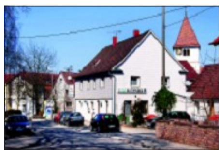
Die Pizzeria König ist in die Karlstraße umgezogen. Nun soll „was Deutsches“ folgen.

Aber ja. Wenn man das ein paar Mal übt, klappt das bestens. Aber natürlich ist nicht jeder Mensch gleich, auch nicht immer gleich drauf. Wichtig ist, dass es einen Kanon an Verhaltensmöglichkeiten gibt, wie ich ihn am Sonntag bei meinem Vortrag beschreiben will. Entspannungsübungen, eine kleine Bewegungspause bei langen Fahrten, mit den Händen einen kleinen Ball kneten – es gibt tausenderlei Möglichkeiten. Beispielsweise auch im größten Gedränge und der Hektik einen Vordermann reinlassen, eine andere Wegstrecke fahren oder – lachen Sie nicht: vielleicht mal auch bei trockenem