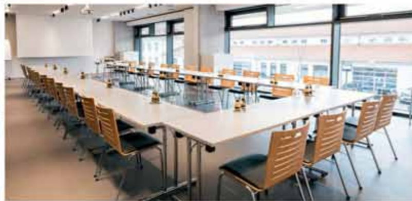
TAGUNGSRÄUME UND EVENTFLÄCHEN | GESAMT 600QM ODER AUFTEILBAR | BIS 200 PERSONEN | BEFAHRBAR UND FAHRZEUGLIFT | MODERNE TAGUNGSTECHNIK