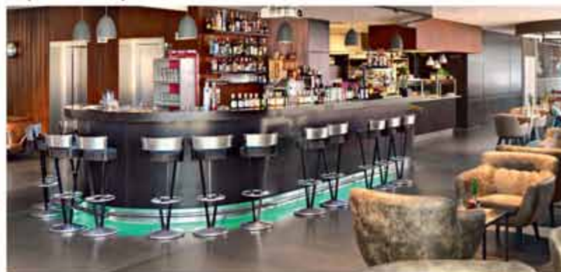
FRÜHSTÜCK | RESTAURANT PICK-UP | V8 BAR