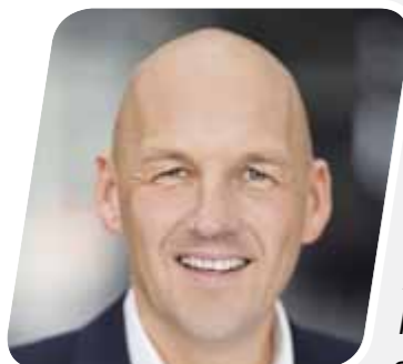
Marc Biadacz Mitglied des Deutschen Bundestages

Ich freue mich, dass wir in einem der wirtschaftsstärksten Landkreise herausragende Einrichtungen haben, die Innovation mit Zukunft vorantreiben.