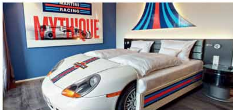
DESIGN DOPPELZIMMER | AUTOMOBILE THEMENZIMMER APPARTEMENTS FÜR LONGSTAY | SUITE | FITNESS WELLNESS